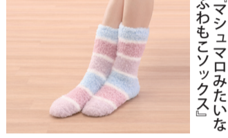
『マッシュマロみたいなふわもこソックス』