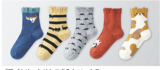
『口ゴムゆったりねこまみれソックス』

靴下製造総合卸「三笠」の「靴下在庫一掃セール」が上記の日程で開催されます。毎日10時～17時、毎日違う柄を楽しめる5柄セットのねこまみれソックスやふわふわボリュウムが気持ちいいマッシュマロタッチのふわもこソックスなど、人気の品を多数用意しています。 ※今年もパッケ詰めされた商品のみ販売です。 《2000円以上購入すると、靴下のプレゼントも!》